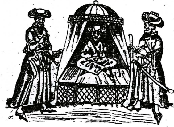
رسم رقم (٤) السلطان محمد بن قايتباي جالس على عرشه ويقف على جانبه حارسان

هذا وقد رسم أرنولد فون هارف السلطان وهو جالس تحت هذه المظلة التي كانت على هيئة قبة تتدلى منها ستائر حول الدكة، ويدور حول القبة أفريز مزين بزخارف من معينات، ويجلس السلطان فوق وسائد ثلاث محشوة وضعت فوق غطاء من القماش يتدلى حتى الأرض وتزينه زخارف المعينات. ويضع السلطان فوق رأسه عمامة مملوكية من تلك العمامات التي استحدثها السلطان الناصر محمد بن قلاوون، ويقبض السلطان بيده اليمنى على عصا كالصولجان، أشبه بالدبوس، وعن يمينه ويساره مملوكان من السلاح دارية تمنطق كل منهما بالسيف، وفوق رأس كل منهما عمامة تختلف الواحدة عن الأخرى، وتبدو عمامة المملوك على يسار السلطان وكأنها لفت حول شربوش، ويلبس كل من المملوكين خفا في رجليه يقال له السقمان، وكان غالباً يتخذ من الجلد البلغاري الأسود؛ ويلبس كل منهما قباء فضفاضاً له أكمام واسعة وكمران بحلق وإيزيم. وكان يحيط بالسلطان رجال الحاشية والقضاة والجنود. (١)